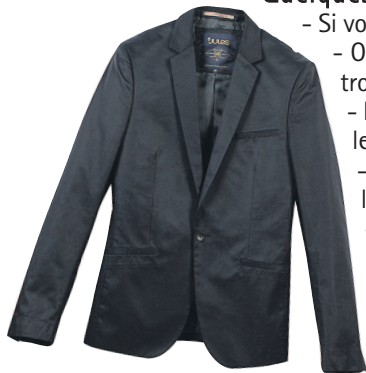
Veste et pantalon chino chez Jules.

S'il y a bien un point sur lequel aucun compromis n'est possible, c'est l'hygiène et l'impression de net. Un vernis écaillé sera du plus mauvais effet. Mieux vaut encore porter un vernis incolore. Des ongles type "tigresse" n'ont absolument rien de chic et n'ont pas leur place dans un look professionnel. Bien entendu, les cheveux sont propres et le maquillage reste naturel, à savoir un teint lissé (lire ci-dessous), du mascara et une touche sur les lèvres.